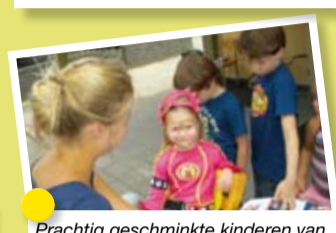
Prachtig geschminkte kinderen van Zaza in Roosendaal tijdens de zomerborrel.