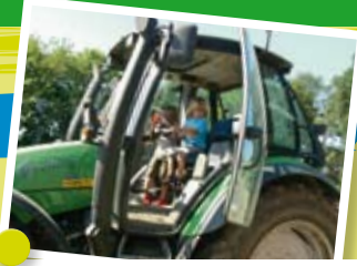
Het zomerfeest van de peuters van 't Kruijmelsoosje in Teteringen.