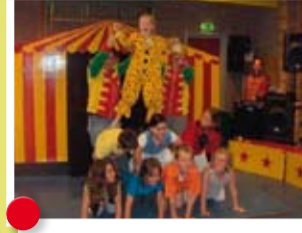
De kinderen van bso Zeggetuin uit Zegge bleken echte circusartiesten.