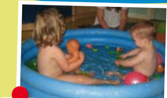
Bij kinderdagverblijf Kasteeltuin in Breda spetterde het flink in de zomer.