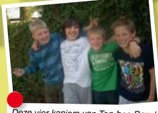
Deze vier kanjers van Top bso Bavel organiseerden een geslaagde sportdag.