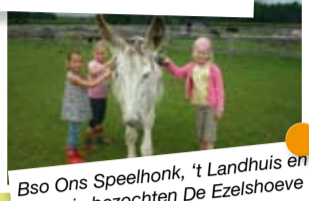
Bso Ons Speelhonk, 't Landhuis en Kloktuin bezochten De Ezelshoeve in Baarle-Nassau.