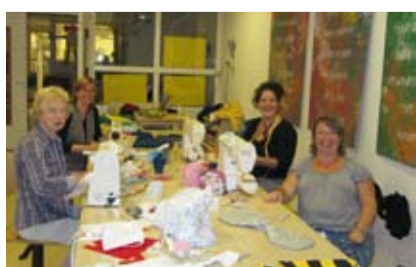
Vorbereiding modeshow Kasteeltuin