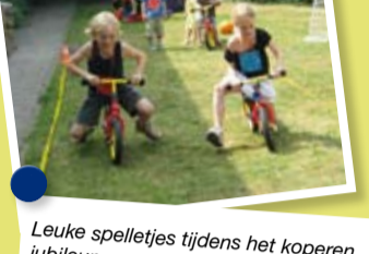
Leuke spelletjes tijdens het koperen jubileum van de Petteflet in Breda.