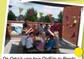
De Orka's van bso DolFijn in Breda openden het opgeknapte dakterras met champagne.