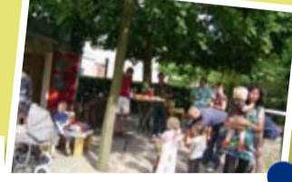
Een geweldige vaderdagborrel bij Harlekijn in Breda!