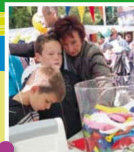
Kinderen raden hoeveel ballonnen er in de vaas zitten tijdens het Roosendaals Treffen.