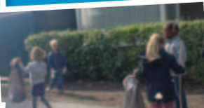
Bso Hupsakee ruimt op in de buurt. Ook buurtkinderen hielpen een handje mee!