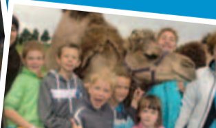
Na een reis met de bus, trein en bus naar de kamelenboerderij in Berlicum kregen de kinderen van bso Dino uitleg over kamelen en dromedarissen, en mochten ze een jonkie verzorgen.