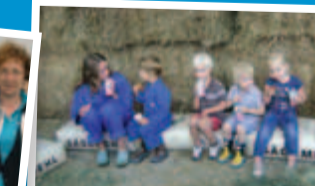
De kinderen van peuterspeelzaal Robbedoes en de grotere kinderen van kinderdagverblijf Droomtuin gingen met de huifkar (achter een tractor) naar de boerderij.