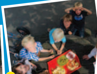
De kinderen van bso Leeuwentuin mochten een vriendje of vriendinnetje meebrengen om op de bso te komen spelen