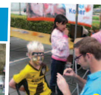
Als maatschappelijk partner van de Kidsclub was de Kober groep prominent aanwezig tijdens de open dag bij NAC Breda.