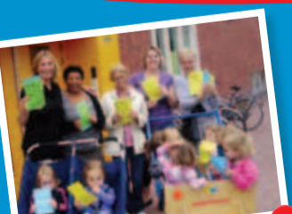
Kinderdagverblijf DolFijn in Breda organiseerde een Fancy Fair. De hele buurt werd uitgenodigd. Er werd volop verkocht. Zelf gebakken koekjes, bloempotjes en eierkoeken die ze gratis van de bakker kregen. De opbrengst is voor Kika.