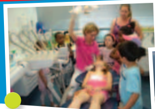
Bso Grote Bommel ging op bezoek bij de tandarts en maakte kennis met hygiëne regels en leerde hoe je je tanden goed moet poetsen.