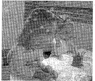
Kleine Humpie Dumpie kaboutertjes onbezorgd aan de slag